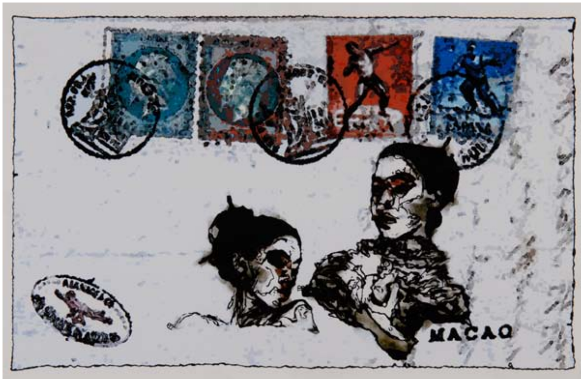
Alan Humerose, Macao

Celle-ci a lieu dans la Maison de Quartier des Eaux-Vives : le temps d'un week-end, le lieu accueille les œuvres de la collection d'Ariel et de sa femme Cléo, qu'il est possible d'emprunter pendant une année pour 100 francs seulement. Ainsi naît la première bibliothèque de tableaux de Suisse romande, baptisée Pinacothèque des Eaux-Vives en hommage au quartier qui l'a vue naître. L'agrandissement du fonds ainsi que le développement des activités autour de la collection, destinées à promouvoir l'art pour tous, amène à l'ouverture en 1996 d'une arcade dévolue à la Pinacothèque au chemin Neuf, toujours dans le quartier des Eaux-Vives.