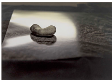
Caillou, (Cecilia Menge Torbjörnsson)